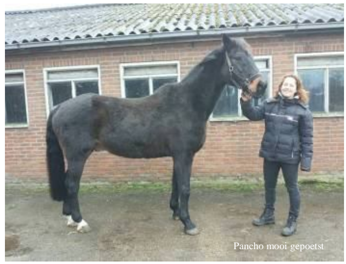
Pancho mooi gepoetst