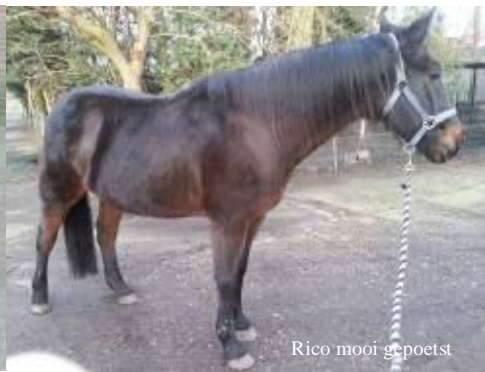
Rico mooi gepoetst