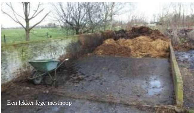
Een lekker lege mesthoop

Omdat we pas halverwege de winter zijn en onze mesthoop inmiddels aardig vol was, hebben we deze door de loonwerker leeg laten rijden. De oude mest is verplaatst naar een depot bij ons aan huis, zodat we nu weer voldoende ruimte hebben en we alle paarden- en koeienstallen weer wat gemakkelijker uit kunnen mesten.