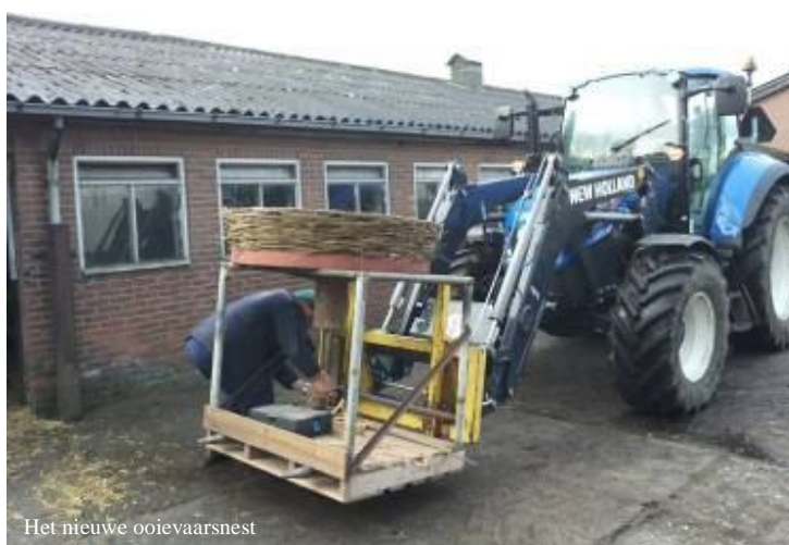
Het nieuwe ooievaarsnest

Omdat het ooievaarsnest in onze wei wel regelmatig bezocht werd door ooievaars, maar nooit tot permanente woning werd verklaard, heeft schoonvader Frans een mooi nieuw nest gemaakt. Het oude nest is verwijderd, en met onze tractor is het nieuwe exemplaar op de oude paal geplaatst. Nu is het afwachten dus tot ze weer langs komen vliegen, en hopen dat er dan een paartje bij ons in Brabant wil blijven wonen.