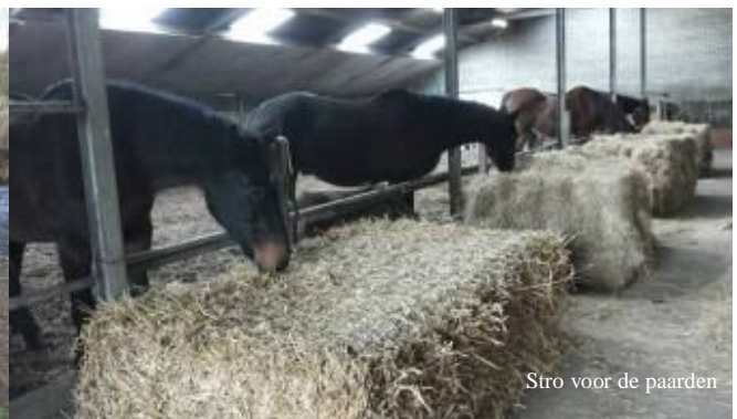
Stro voor de paarden

Sommige paarden en pony's hadden nog wat last van dunne mest vanwege de overgang van gras naar hooi. De paardengroep hebben we daarom bijvoorbeeld stro gevoerd naast hun gebruikelijke hooi omdat dat een stoppende werking heeft. Ook hebben we veel staarten gewassen . Geen heel fijn klusje, omdat het buiten niet bepaald warm is. We hopen dan ook dat alle paarden- en ponystaarten de rest van de winter mooi schoon zullen blijven.