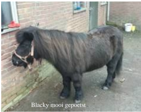
Blacky mooi gepoetst