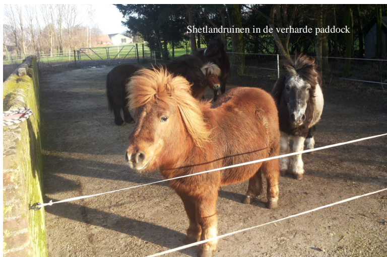
Shetlandruinen in de verharde paddock

Shetlander Arlando is deze maand verhuisd naar een “gewone” pensionstal iets dichterbij de woonplaats van zijn baasje.. We hopen dat Arlando het er naar zijn zin zal hebben, en we zullen deze lieverd natuurlijk erg missen.