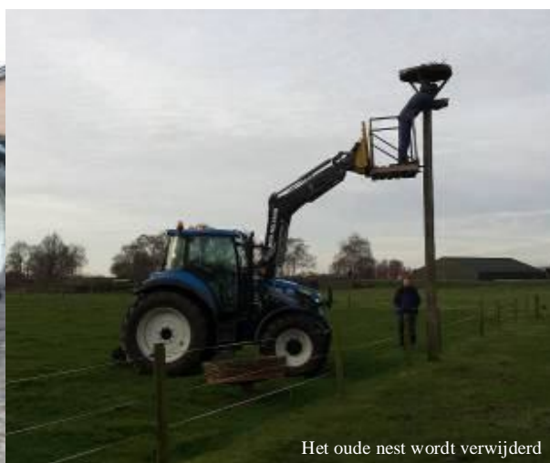
Het oude nest wordt verwijderd

Door de vele regen de afgelopen weken, hebben we nu ook onze kleine pony's nu uit de wei moeten halen. Nissan en Fleur staan in de paddock bij ons aan huis, en bij erg slecht weer staan ze samen in een ponystal bij onze kalfjes. Ook Lizzy, Lizzy en Pukkie staan met zijn drietjes op stal, of buiten op het padje dat tussen de weilanden door loopt van onze boerderij naar de stallen aan de Linieweg.