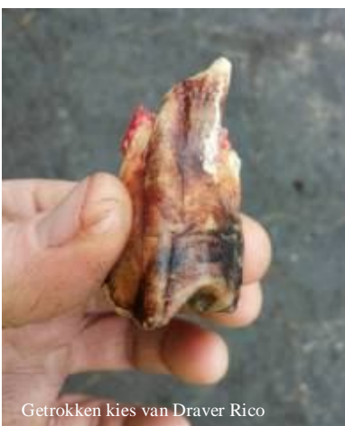
Getrokken kies van Draver Rico