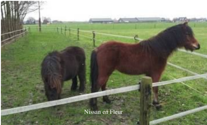
Nissan en Fleur