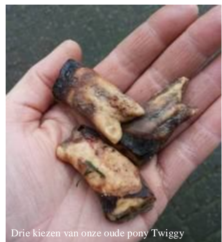
Drie kiezen van onze oude pony Twiggy

De dierenarts heeft het verder druk gehad bij ons deze maand... Bij onze nieuwe pony van vorige maand, Mr Joe , heeft ze geprobeerd zijn traanbuizen open te spuiten en is ook onder verdoving zijn koker schoongemaakt. Tenslotte nog een zalfje voor zijn ogen en inmiddels gaat het weer helemaal prima met deze oude heer. Onze