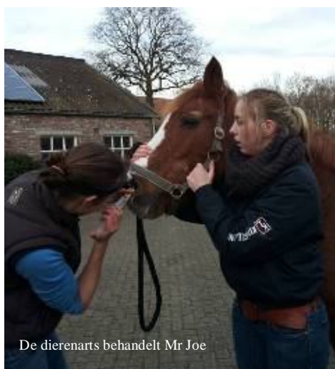
De dierenarts behandelt Mr Joe

KWPN-er Nimphe had een opgezwollen achterbeen. Waarschijnlijk heeft ze een trap gekregen of is er wat vuil gekomen in een oude draadwond aan dat been. Met een antibioticakuurtje en vochtafdrijvers, gecombineerd met afsprengen en veel beweging, was het been gelukkig binnen enkele dagen weer helemaal beter. Ook Haflinger Wibo had problemen met zijn benen. Hij had zich waarschijnlijk verstapt, waardoor hij kreupel liep. Gelukkig is dit na een paar daagjes rust vanzelf weer helemaal over gegaan. Ook met ons blinde Gelderse paard Irzan gaat het nu gelukkig weer goed. Hij was erg afgefallen, maar nu hij in een box staat is hij weer mooi op gewicht gekomen.