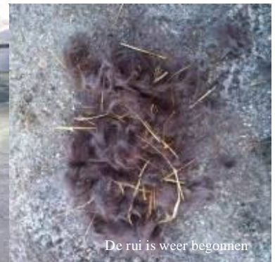
De rui is weer begonnen

Onze Welshpony Waltertje had een erg slechte vacht doordat hij last heeft van een ziekte genaamd Cushing. Hij stond dan ook flink te zweten op stal. We hebben hem nu geschoren, en met een lekker warm dekentje op voelt Walter zich weer helemaal top. Hij staat samen met onze Ijslander Fylkir binnen, en beide heren krijgen slobber bijgevoerd. Zij hebben namelijk allebei last van gevoelige darmen en kunnen het hooi niet meer zo goed verteren.